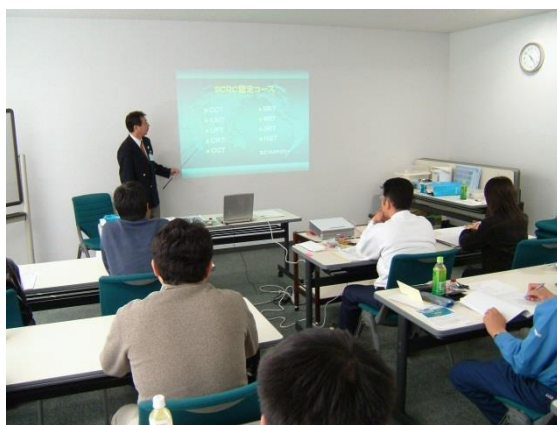
過去に開催したスクールの様子